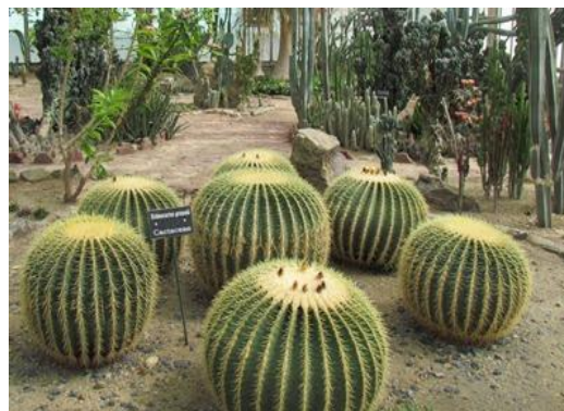
شکل ۱- گونه Echinocactus grusunii در گلخانه کاکتوس باغ گیاه‌شناسی ملی ایران

مناطق خشک و نیمه‌خشک حدود ۳۰ درصد از سطح قاره‌های جهان را پوشش می‌دهند. کاکتوس‌ها مجموعه‌ای از سازگاری‌های عجیبی دارند که با شرایط کمبود آب، به آنها امکان چندساله و همیشه‌سبز بودن می‌دهد. بیشتر کاکتوس‌ها در زیستگاه‌هایی زندگی می‌کنند که تحت خشکسالی شدید قرار دارند. در قرن‌های بیستم و بیست و یکم، محبوبیت کاکتوس‌ها به دلیل توانایی رشد و نمو با آبیاری کم یا بدون آبیاری افزایش یافت. آنها به نگهداری کمی احتیاج دارند و ممکن است در طبیعت غذایی برای جانداران دیگر نیز باشند. کاکتوس‌ها در ایران گونه بومی ندارند. ظاهر کاکتوس‌ها نتیجه یک روند سازگاری طولانی و دشوار با محیطی خشک و سخت است.