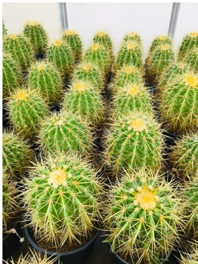
شکل ۴- اکینوکاکتوس تکثیری از بذر

باغچه و ورمی کمپوست با زهکش مناسب است. زمان آبیاری آن زمانی است که خاک آن خشک شده باشد البته در فصل رشد (بهار و تابستان) به آبیاری منظم نیاز دارد. اکینوکاکتوس تولید پاجوش و تنه‌جوش نمی‌کند و تکثیر آن از طریق بذر است. این گیاه در سن بالا به مرحله گلدهی و بذر می‌رسد. با توجه به این موضوع