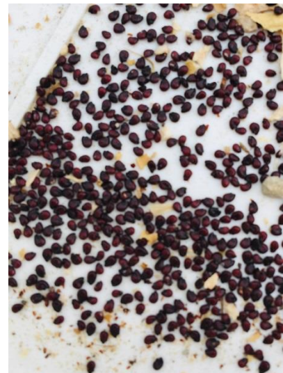
شکل ۳- بذر اکینوکاکتوس